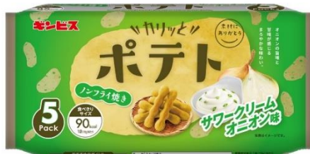
カリッとポテト サワークリームオニオン味 5P