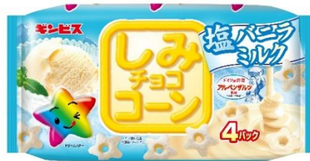
しみチョココーン塩バニラミルク 4P