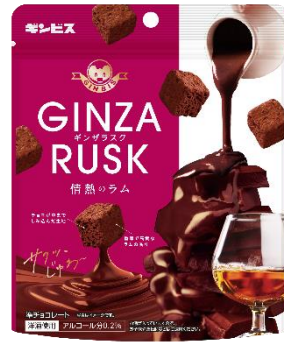
GINZA RUSK 情熱のラム 50g