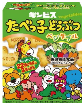
たべっ子どうぶつベジタブル 55g/5P