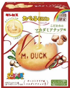
たべっ子どうぶつ こだわりのマカダミアナッツ味 50g