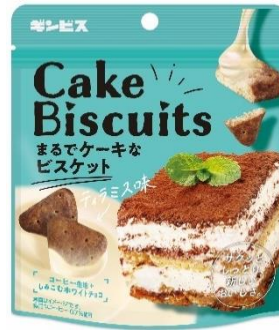
まるでケーキなビスケット ティラミス味 50g