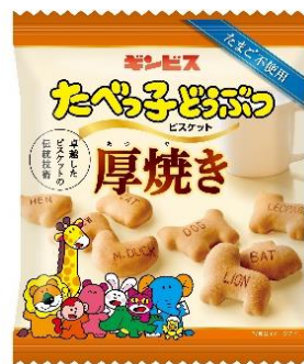
厚焼きたべっ子どうぶつ 55g