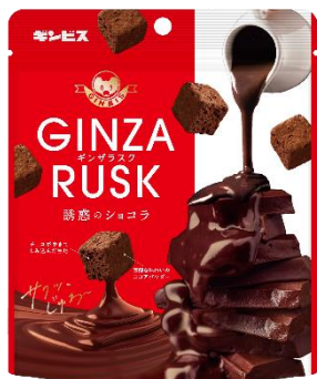
GINZA RUSK 誘惑のショコラ 50g ※リニューアル