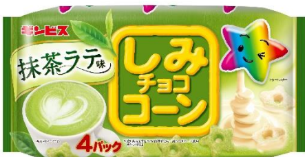
しみチョココーン抹茶ラテ味 4P