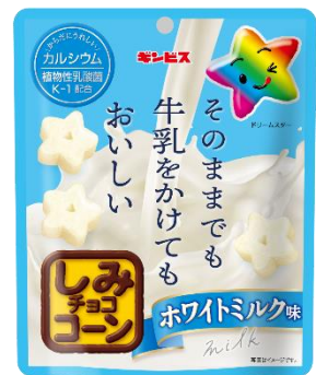
そのままでも牛乳をかけてもおいしい しみチョココーン ホワイトミルク味 50g