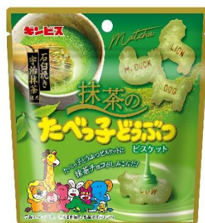
抹茶のたべっ子どうぶつ 40g