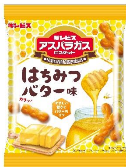
ミニアスパラガス はちみつバター味 58g / 28g