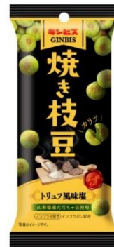
焼き枝豆 トリュフ風味塩 38g