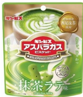
チョコがしみこんだミニアスパラガス 抹茶ラテ味 37g