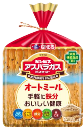
アスパラガス オートミール 125g