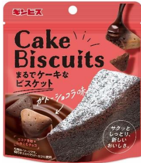
まるでケーキなビスケット ガトーショコラ味 50g