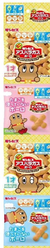
ミニアスパラガス ポーロ 4 連