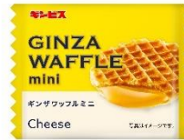
ギンザワッフルミニ 癒しのチーズケーキ風味 (9g × 8 枚入)